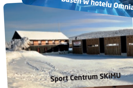
Sport Centrum SKiMU