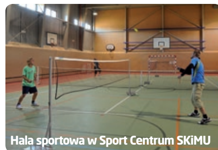
Hala sportowa w Sport Centrum SKiMU