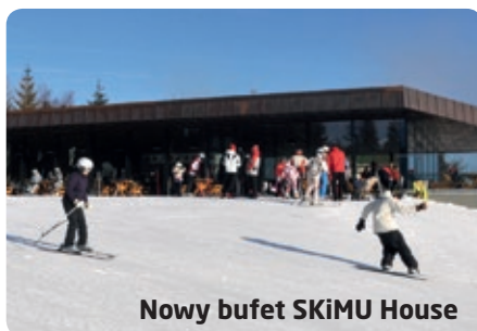
Nowy bufet SKiMU House