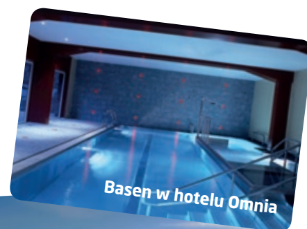
Basen w hotelu Omnia