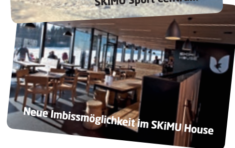
Neue Imbissmöglichkeit im SKiMU House

NACH DER ANKUNFT GERADEWEGS AUF DIE PISTE!