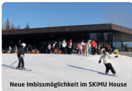
Neue Imbissmöglichkeit im SKiMU House