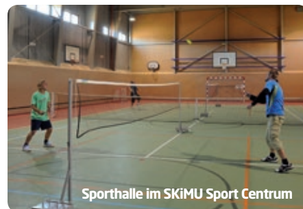
Sporthalle im SKiMU Sport Centrum