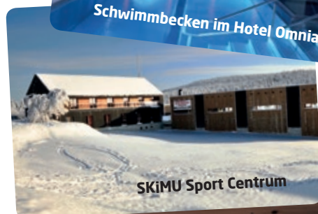
SKiMU Sport Centrum