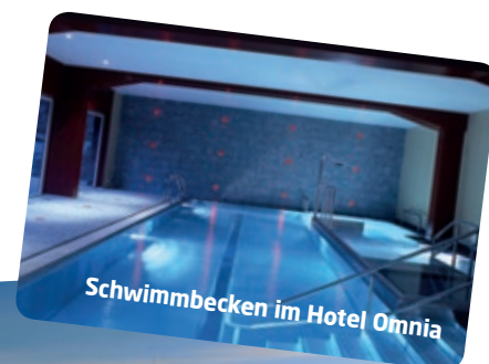
Schwimmbecken im Hotel Omnia