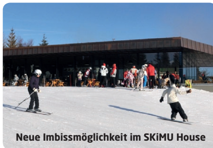
Neue Imbissmöglichkeit im SKiMU House