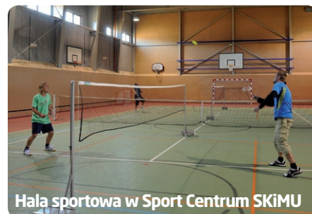
Hala sportowa w Sport Centrum SKiMU