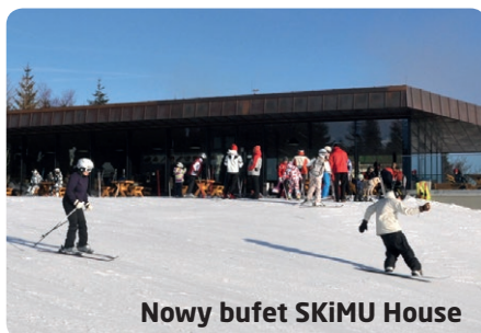
Nowy bufet SKiMU House