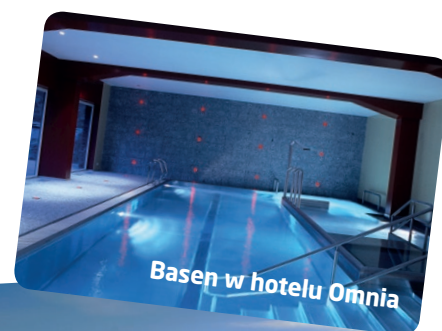
Basen w hotelu Omnia