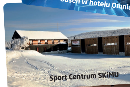
Sport Centrum SKiMU