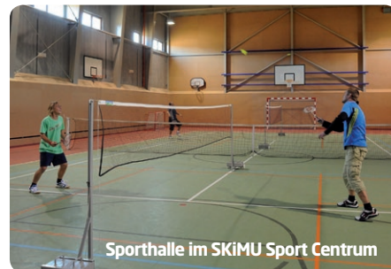
Sporthalle im SKiMU Sport Centrum