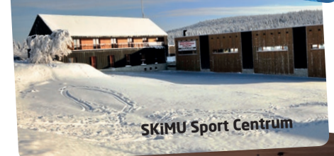
SKiMU Sport Centrum