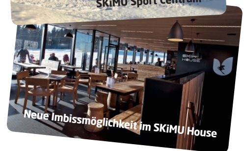
Neue Imbissmöglichkeit im SKiMU House

NACH DER ANKUNFT GERADEWEGS AUF DIE PISTE!