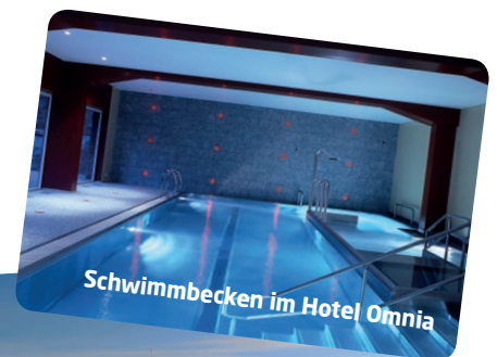
Schwimmbecken im Hotel Omnia