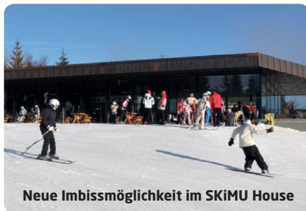
Neue Imbissmöglichkeit im SKiMU House